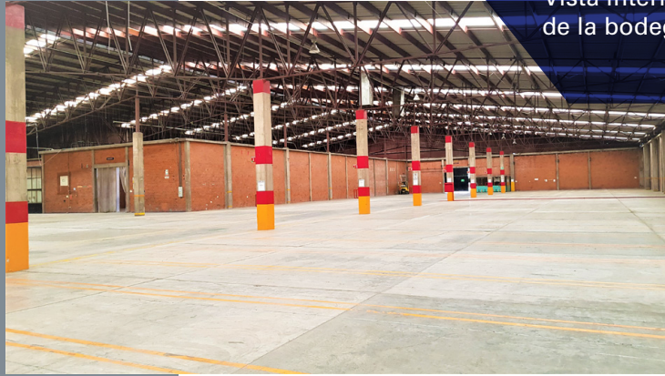
Vista interior de la bodega