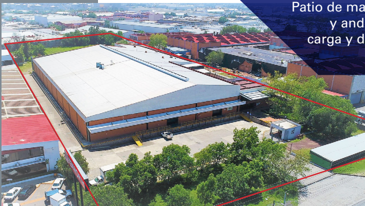
Patio de maniobras y andenes de carga y descarga frontal.